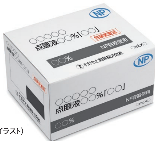
個装箱 (イメージイラスト)